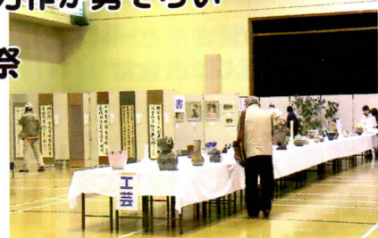
▲8部門・338点の作品が並ぶ会場