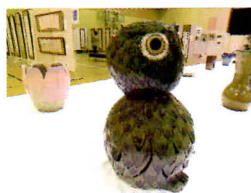
▲「ふくろう」(工芸の部)

は豊かな感性が十分に表現されていました。また、和歌や唐詩などの書や、工芸品の菩薩像や花器などのほか、さまざまな色と素材を生かした手芸品には、細部にわたる技術やこだわりを感じました。