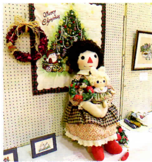
▲「welcomeドール もうすぐクリスマス」(手芸の部)

10月23日から28日までの期間、第17回鹿嶋市芸術祭がまちづくり市民センター体育館で開催されました。