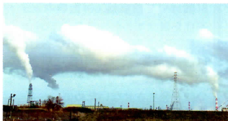
▲市内でよく見られる煙突から生まれる雲

さて、皆さんは市内で写真のような風景を見たことがありますか。これは煙突から出る煙に含まれている微細な塵を核に、空気中の水蒸気が冷やされ凝