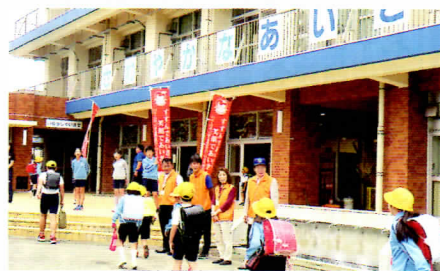
▲市内小学校でのあいさつ声かけ運動

これからの子育ては、家庭・学校・地域のつながりが大きな役割を持つと思います。大人と子ども、大人同士・子ども同士のコミュニケーションの輪が広がり、子どもの安全が守られるよう、青少年相談員として「地域の子どものための母」のつもりで、これからも活動していきたいと思っています。